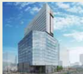
大和ハウス工業(株)