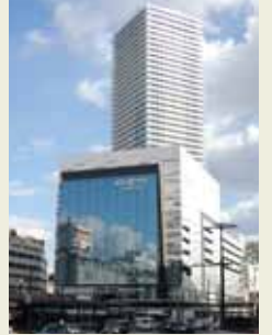
エキシティ・ヒロシマ [広島駅南口Cブロック市街地再開発事業]