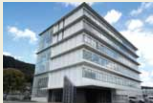
広島県歯科医師会館