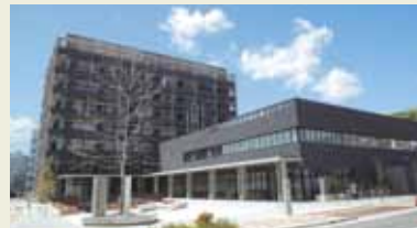
広島県医師会館 広島がん高精度放射線治療センター