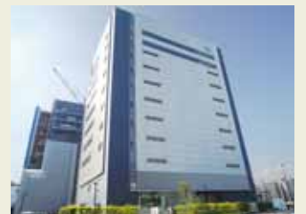
(株)エネルギー・コミュニケーションズ