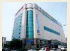
エールエールA館 [広島駅南口Aブロック市街地再開発事業]