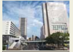
アクティブインターシティ広島 [若草町地区市街地再開発事業]