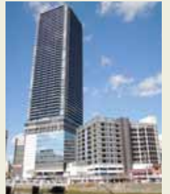
ビッグフロントひろしま [広島駅南口Bブロック市街地再開発事業]