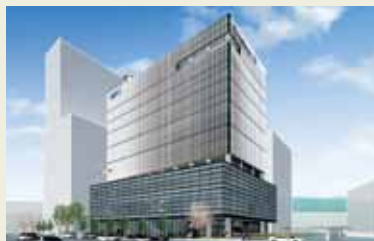
広島テレビ放送(株)